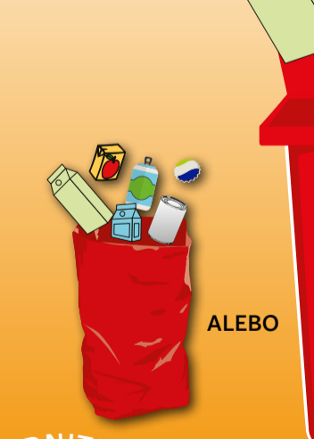
PODĽA SYSTÉMU ZBERU VO VAŠEJ OBCI