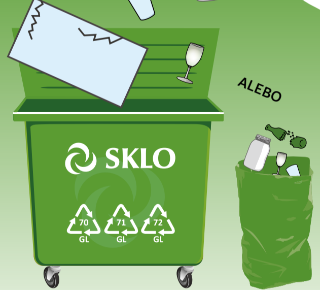
PODĽA SYSTÉMU ZBERU VO VAŠEJ OBCI