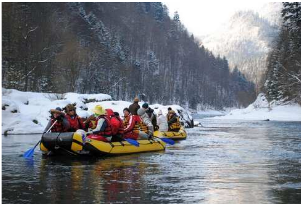
Jánošíkov skok. Počas splavu do vody našťastie nik neskočil.