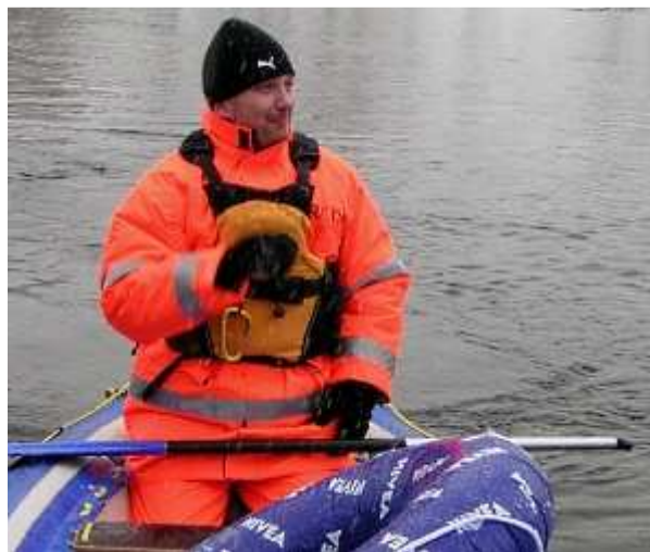
Vodák v zimě na Dunajci.

Akcia: Tretie zimné stretnutie vodákov pod Troma korunami.